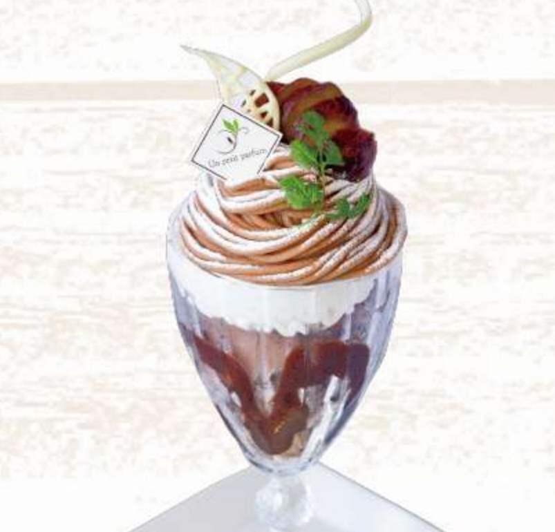
大好評のモンブランを パフェに仕上げました モンブランパフェ