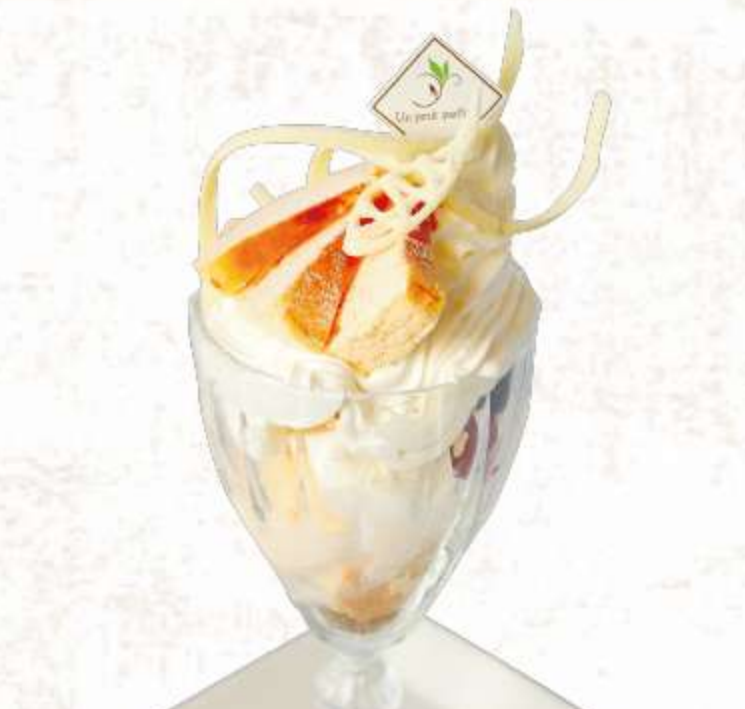
2種類のチーズケーキ (ベイクド・レアチーズ) で仕上げた品 フロマージュブランパフェ