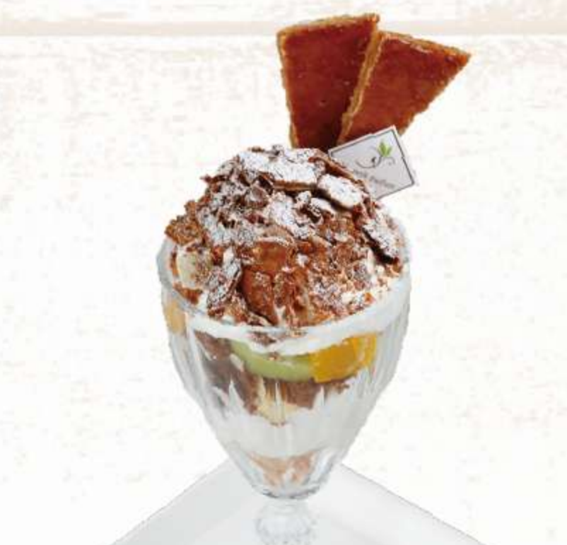
堅焼きパイ生地と クリームのパフェ ミルフィーユパフェ

✦ケーキセット 600円 (390円(税別)以上のケーキ対象) 税込 660円 さらにお得!! ✦Wケーキセット 950円 (390円(税別)以上のケーキ対象) 税込 1,045円 対象外: キャラメルマキアート / オリジナルアイ스티ー / 各種フロート