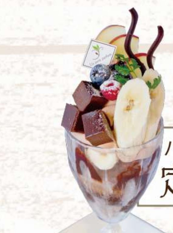
チョコレートを 贅沢に使った一品 チョコレートパフェ