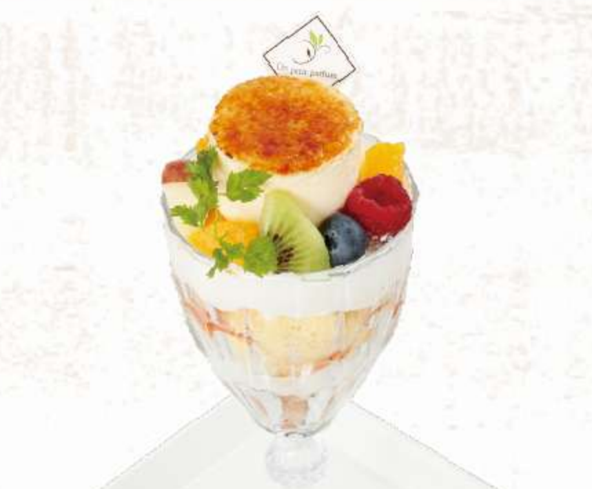
パリ発祥のフランス伝統菓子を 使ったパフェ シブースト風クリームムースパフェ