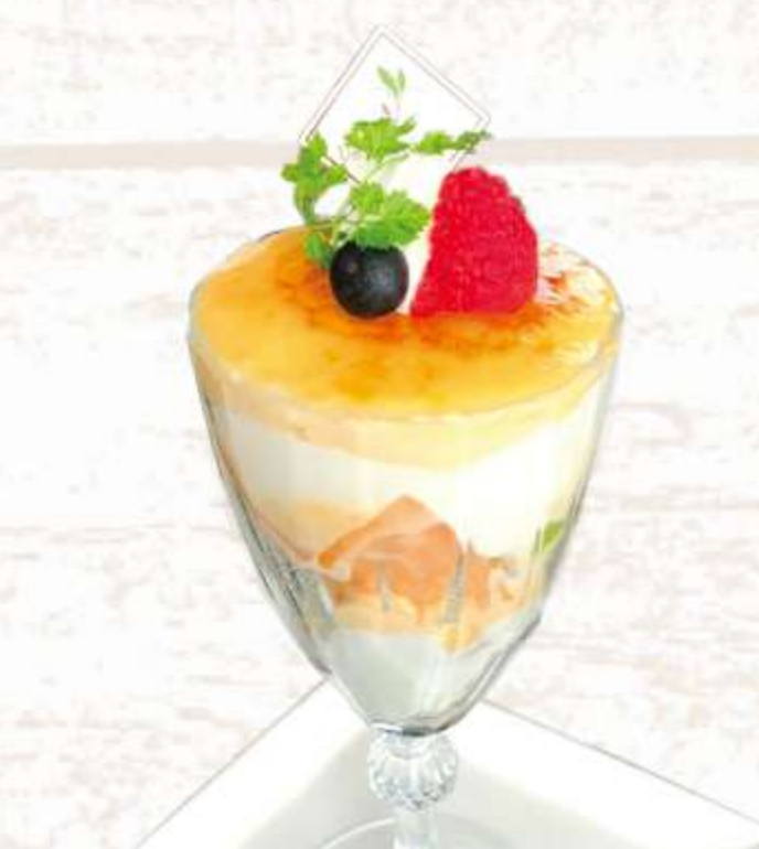
人気の濃厚プリンを 使ったパフェ クレムブリュレパフェ