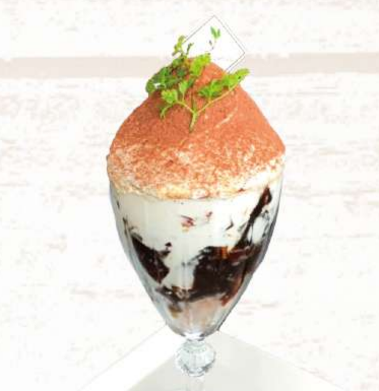
3種類のチーズを使用 (マスカルポーネ・ゴダ・クリーム) ティラミスパフェ