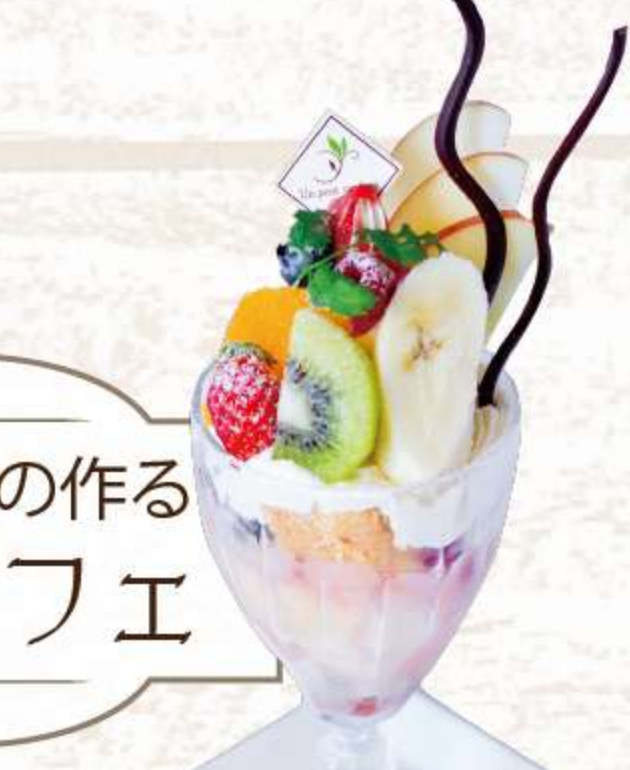
季節のフルーツが たっぶり フルーツパフェ